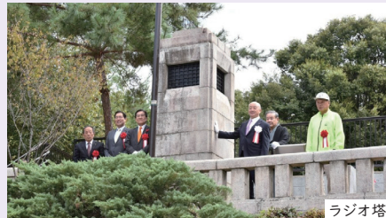
記念イベント ラジオ塔

船岡山公園のラジオ塔は、昭和初期に設置され、今も現役。毎朝のラジオ体操に活用される、地域のシンボリック存在です。この度、京都紫野ロータリークラブ様から、ラジオ塔の改修工事をご寄付いただきました。