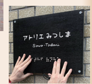
アトリエみつしまの点字看板