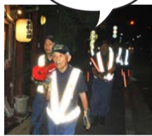
↑消防団の夜回りの様子