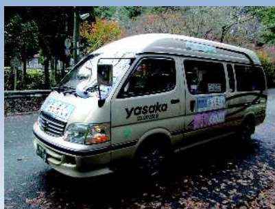
雲ヶ畑バス「もくもく号」