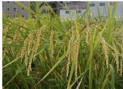
学区内に今も実る美味しいお米