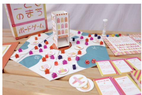
まちに家やインフラを整備して、住みやすい環境が整うほど住民が集まり、「ハッピー」が貯まる仕組み

秀島：プレイヤーがまちのリーダーとなり、①家の建設、②インフラ整備、③住民集め、④まちびらきの各ステージに進み、「ハッピー」というポイントの獲得を競います。ゲーム終盤、まちの中心のタワーからサイコロを転がし、まちに予期せぬことが起こるシーンでは、プレイヤー全員がハラハラドキドキ！対象年齢8歳以上、2～6人が同時に遊べ、子どもからお年寄りまで一緒に楽しみながらまちづくりの難しさや意義を実感できるゲームです。