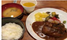
子ども食堂での料理