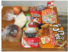
寄付いただいた食品