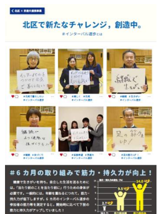
リーフレット(表紙)

リンク先 URL : https://www.city.kyoto.lg.jp/kita/page/0000249058.html