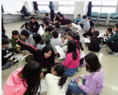
まちのコンセプトについて、意見を出し合い考え中。

前回の会議で決まった「北区こどものまち」の目指す姿：「みんなが楽しいまち」。今回の会議では、目指す姿をもとに、「楽しいまちってどんなまち？」「まちづくりの中で何を大切にしているか？」について話し合いました。少し難しいテーマでしたが、「まちのルールを守って安心安全に過ごせること」「みんなが笑顔で仲がいいこと」「みんなが自由であること」という3つの目標を大切に