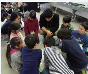
たくさんの通貨単位アイデアが出てきました。

会議の中盤では、まちに出店するお店とそれぞれのお店の店長を決めました。どういうお店をやりたいかアイデアを出した後に、お店の種類を考えながら、似ている