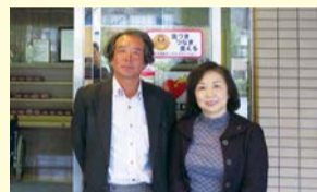
3月21日、高齢者福祉施設「紫野」に、最初のステッカーを貼らせていただきました!