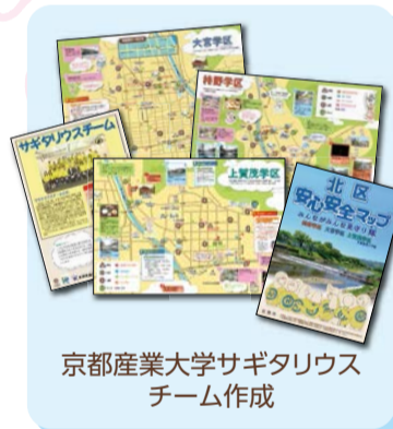
京都産業大学サガリウスチーム作成

京都産業大学および佛教大学の学生の皆さんが、大学周辺地域のフィールドワークや聞き取り調査を行い、安心・安全情報をまとめた「安心安全マップ」が完成しました。このマップは、北区役所地域力推進室で配布しています。