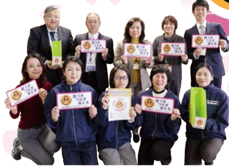
北区高齢すこやかステーション運営委員会メンバー