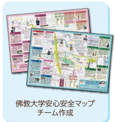
佛教大学安心安全マップチーム作成