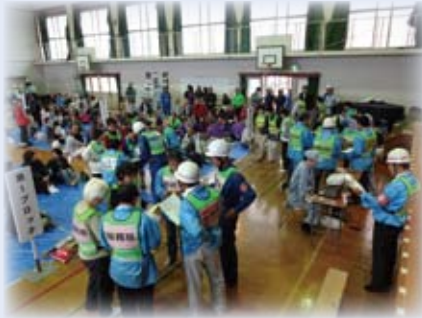
避難所運営訓練の様子

北区防災会議と衣笠学区自主防災会、北消防団衣笠消防分団を中心に、地域防災力向上のため、直下型地震を想定した総合的な訓練を実施します。 今回は、消火・救出・避難などの初動訓練とともに、昨年度に策定した「衣笠学区避難所運営マニュアル」に基づき、地域の方が主体となった避難所運営訓練を進めていきます。 また、平成24年7月に締結した「京都市北区における大学・地域包括連携協定」に基づき、地域・大学・行政機関が連携した訓練を計画しています。 日時 10月19日(日) 午前8時30分〜正午 場所 衣笠小学校 問合せ 地域力推進室防災担当 ☎432・1199 *訓練会場に駐車場はありません。