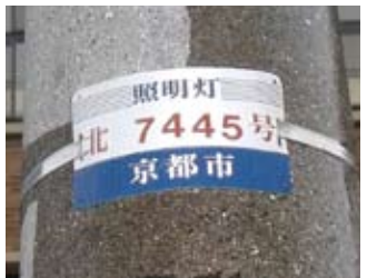
京都市の道路照明灯番号