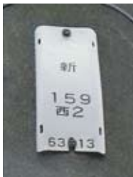
関電と NTT の電柱番号

す。ご連絡いただく際には、照明灯を取り付けている電柱の中ほどに番号札がありますので、記載の道路照明灯番号（北〇〇〇〇号）をお知らせください。 番号札が無くなっていたり、劣化などで番号が読みづらくなっていたりした場合は、関西電力・NTTの電柱番号や町名などをお知らせいただければこちらで確認させていただきます。 また、新設につきましては、ご希望をお受けし、調査の上、基準に合致すれば設置しておりますが、付近の皆様のご理解をいただくなどご協力をお願いしております。ご質問など、お気軽に点がございましたら、お問い合わせください。