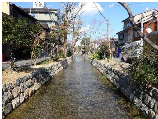
工事前（左）と工事後（右）の高瀬川【下京区六軒橋付近】