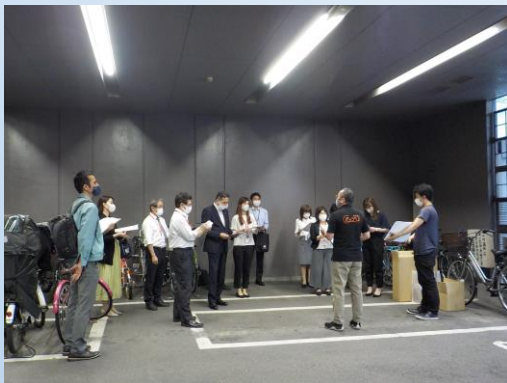
【ルール・マナー講習の様子】 10～15分程度