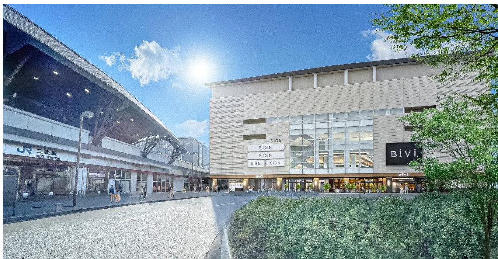
(B i V i 二条)

交通結節点である利便性も最大限いかしつつ、1階、2階の大規模なリニューアルにより、新たな賑わい・交流拠点を構築し、これまで親しんできていただいた地域の方から京都を訪れる観光客まで、誰もが、また訪れたい魅力ある施設を目指します。