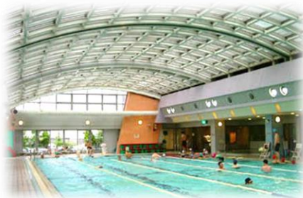
(写真) ラクト健康・文化館