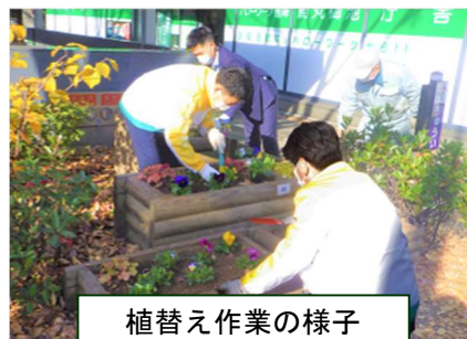
植替え作業の様子