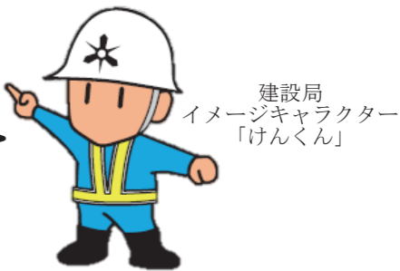
建設局 イメージキャラクター 「けんくん」

住所変更等の手続きに使用していただく「町名地番変更証明書」は無料で発行します。この証明書は令和4年8月に郵送します。