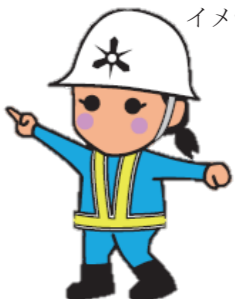
建設局 イメージキャラクター 「せっちちゃん」

住所変更に伴う費用（ゴム印，印刷物等）については御自身で御負担いただくこととなりますので御理解いただきますようお願い申し上げます。