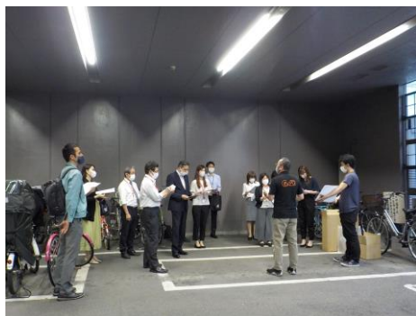
【ルール・マナー講習の様子】