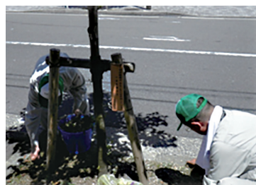
街路樹サポーター

2,597名（令和5年3月末）の方が街路樹とその周辺の美化や緑化に取り組まれています。掃除用具、ボランティア袋の支給や保険への加入など、活動を支援しています。（みどり政策推進室 ☎222-4114）