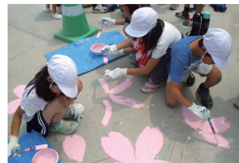
橋に絵を描くイベント「御園橋をキャンバスにしよう」

維持管理に関するゲームを通じて「くらしと土木」を学んでいただく授業も行っています。 (土木管理課 ☎222-3568)