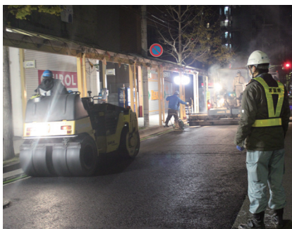
幹線道路の舗装の補修

京都市内には3,241km(令和4年3月末時点)の舗装された道路があります。生活道路の舗装を幅6mで延長50m補修するための費用は約600万円です。幹線道路の2車線分の舗装を100m補修するための費用は約1,000万円です。