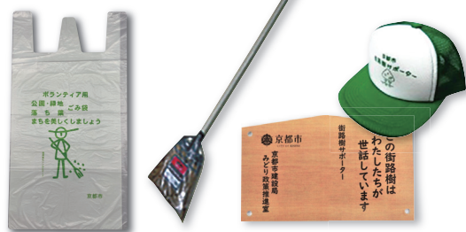
サポーターグッズ