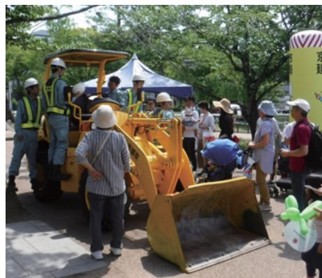
区民ふれあいまつり