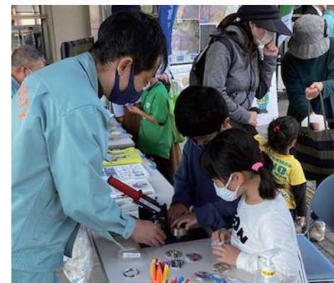
区民ふれあいまつり