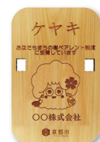
協賛いただいた街路樹と木製プレート（イメージ）