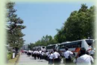
修学旅行生などのおもてなしの場