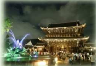
歴史・文化発信の場