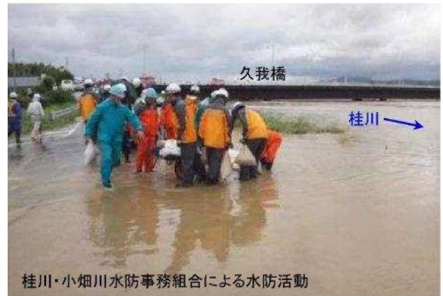
桂川・小畑川水防事務組合による水防活動