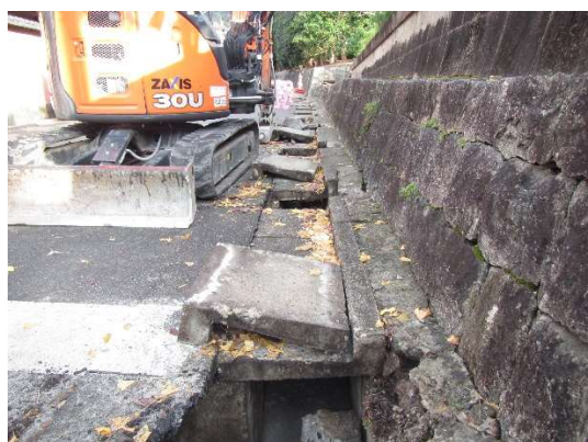
老朽化した既設の L 型側溝を撤去