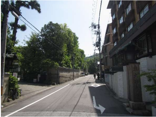
工事前 (東大路通から東側を望む)