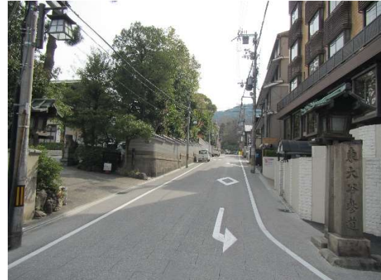
工事完了 (東大路通から東側を望む)