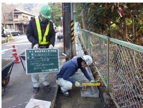
新しい L 型側溝の設置作業