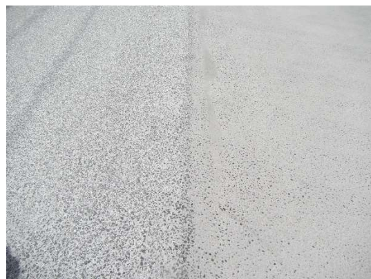
左側がショットブラスト工の完了状況。