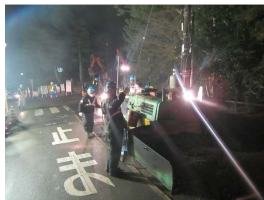
アスファルトフィニッシャーを使用してア スファルト合材を敷きならす。