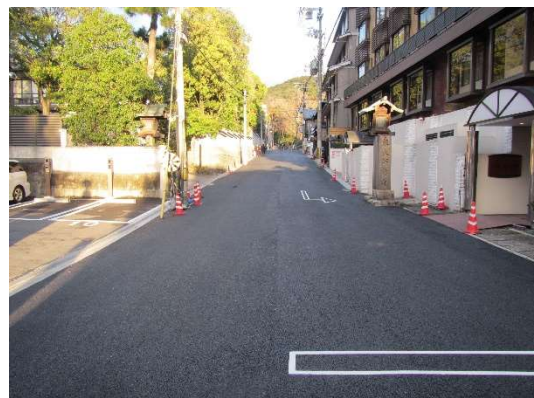
アスファルト舗装工事が完了した状況。東大路通側から東を望む。 表層(表面部分のアスファルト)には、空隙の多い開粒度アスファルト合材を使用。