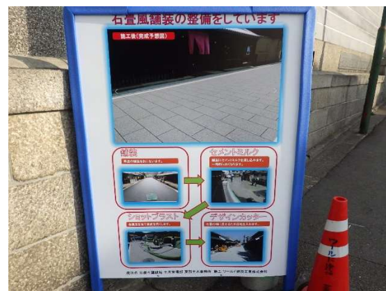
工事の説明看板 (石畳風舗装について)