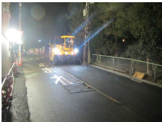
タイヤローラーを使用してアスファルト合材を転圧。