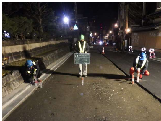
施工管理の状況 (路盤工の高さ測定)