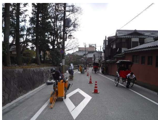
デザインカッター工（アスファルトカッターを使用して表面に切り込みを入れ、石畳風の模様を施す作業。）