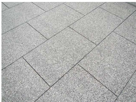
デザインカッター工の完了状況