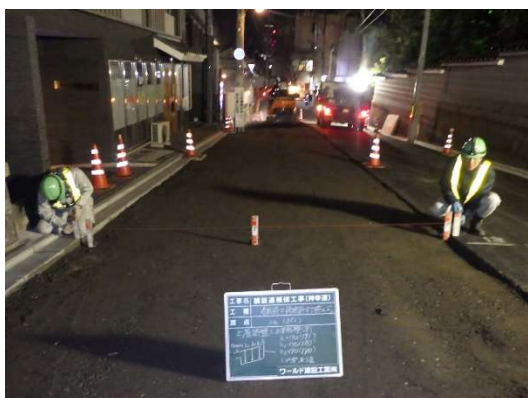
施工管理の状況 (路盤工の高さ測定)