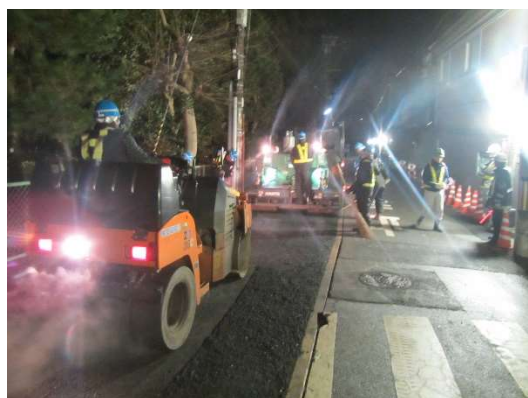
夜間工事の状況 既設のアスファルト舗装を撤去し、 新しいアスファルト舗装を舗装する