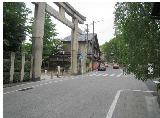
工事完了 (八坂神社南楼門前)