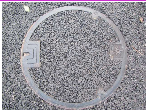
下水道マンホールの蓋には化粧蓋を使用し、蓋の中にもアスファルト合材を施工。