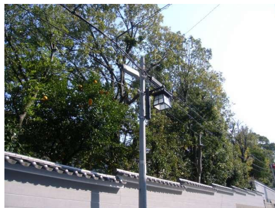
デザイン照明灯の設置