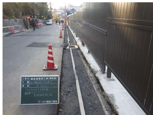
新しい L 型側溝の設置作業