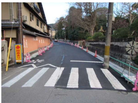
アスファルト舗装工事の途中経過。 (基層工の完了)