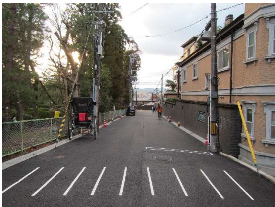
アスファルト舗装工事が完了した状況。ねねの道から西を望む。