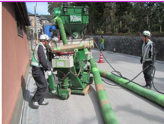
ショットブラスト工（ショットブラスターを使用して、表面の余分なセメントを取り除く作業。）