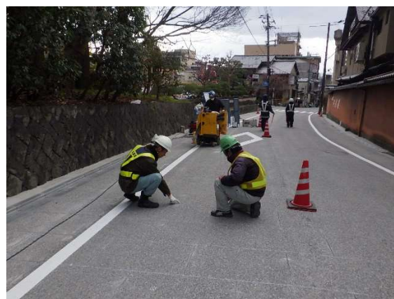
デザインカッター工 （現場確認）