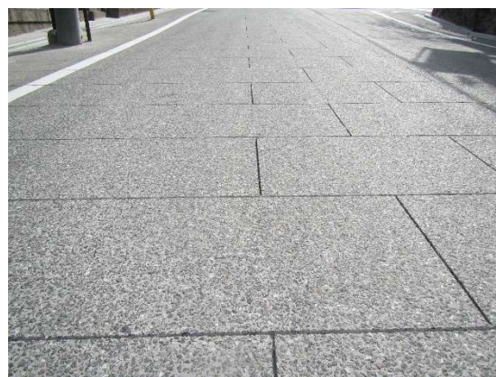
デザインカッター工の完了状況