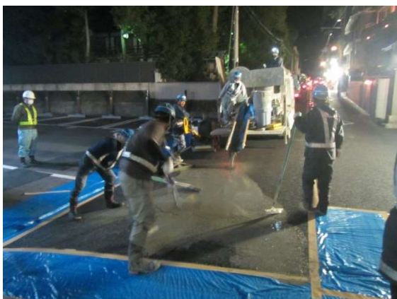
セメントミルク浸透させる夜間工事の状況