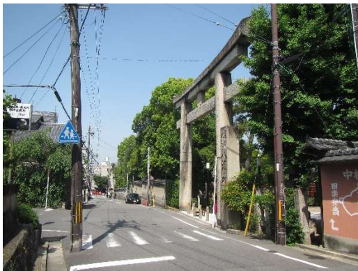
工事前 (八坂神社南楼門前)