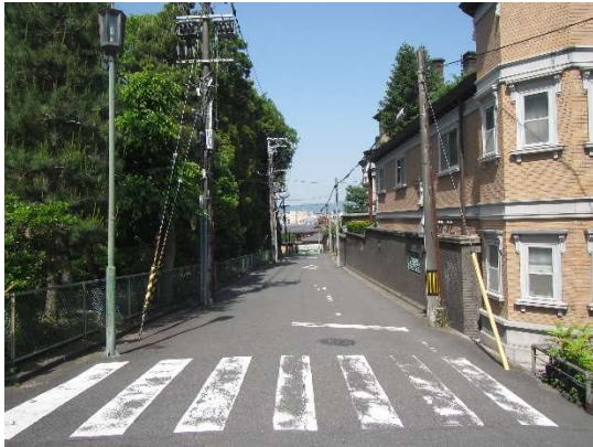
工事前 (ねねの道から西側を望む)