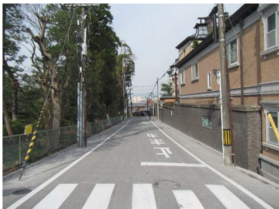
デザイン照明灯の設置