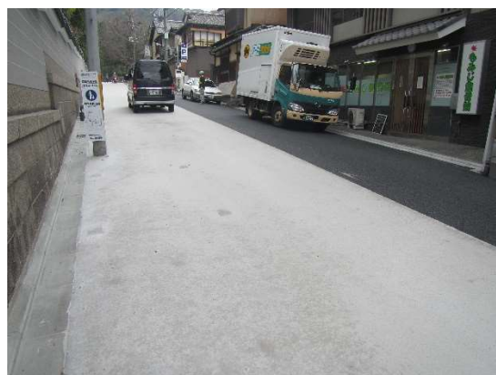
セメントミルク浸透が完了した状況