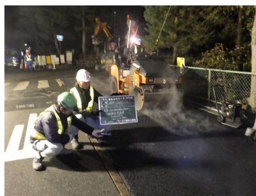
施工管理の状況 (As合材の温度測定)