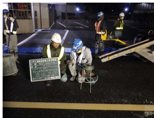
セメントミルクの品質管理 (フロー値の測定)