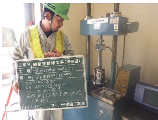
セメントミルクの品質管理 (強度試験)