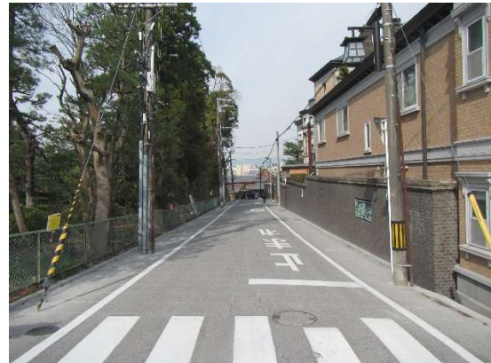
工事完了 (ねねの道から西側を望む)