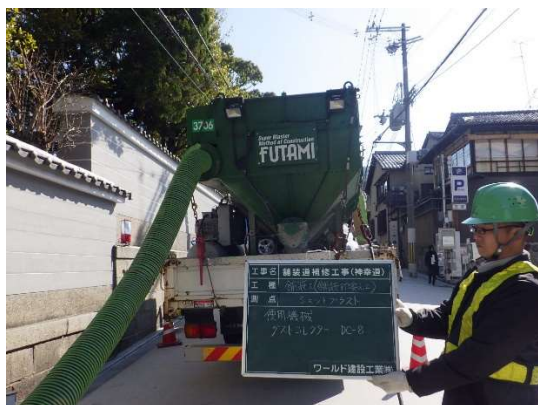
ショットブラスター