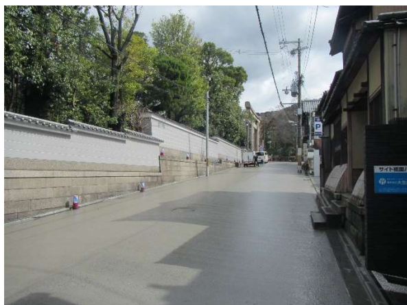
セメントミルク浸透が完了した状況