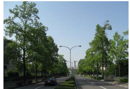
洛西ニュータウン(福西本通)のユリノキ並木