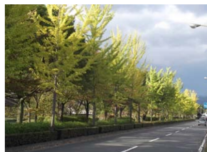
川端通のイチョウの紅葉状況

今回は、「街（がい）サポ」様を紹介させていただきます。「街サポ」様は、川端通（今出川通～荒神橋東詰の区間）の街路樹を対象に、3名の会員の方々に、落ち葉清掃や除草などを中心に活動していただいております。