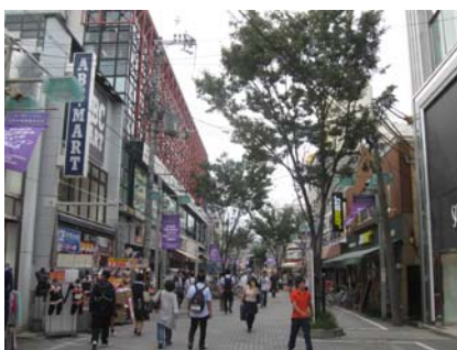
蛸薬師通（河原町通～新京極通）