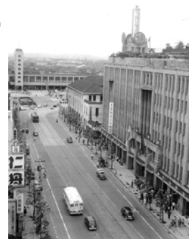
昭和20年代の烏丸通