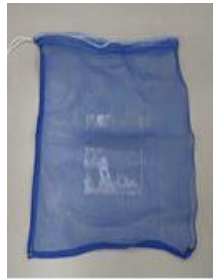
落葉専用袋 (約 70cm×70cm)