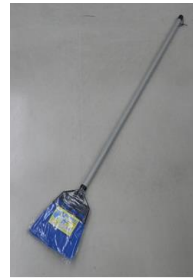
プラスチックほうき