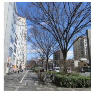
ケヤキの樹勢回復を実施(御池通)