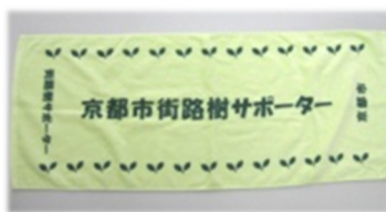
サポータータオル