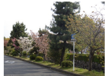
老朽化したサクラの植替えを実施(東堀川通)

花と緑豊かなまちづくりを推進するため、街路樹のない歩道への新規植栽や、老朽化等が進行している街路樹を樹種転換する事業です。平成28年度は竹屋町通、十条通等でおこなっています。