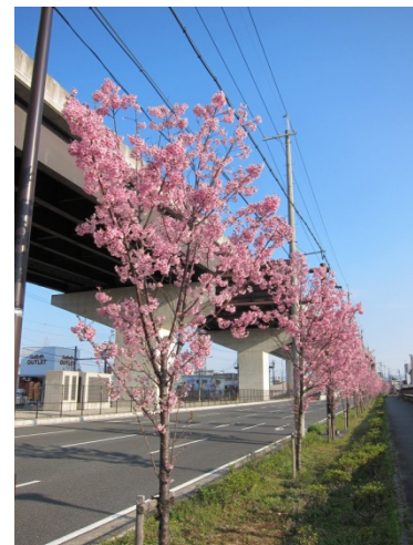
油小路通のヨウコウザクラ

現在、街路樹として多く植栽されているソメイヨシノよりも開花が早く、花の色も濃いピンクであるため、春の訪れを感じられる街路樹です。伏見区の油小路通には約300本の陽光（ヨウコウ）が植えられています。