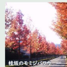
桂坂のモミジバフウ