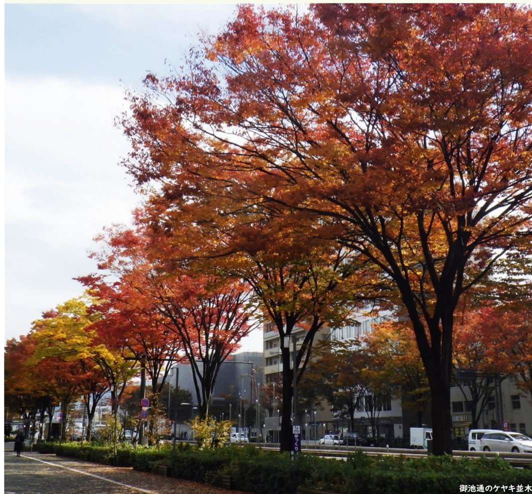
御池通のケヤキ並木