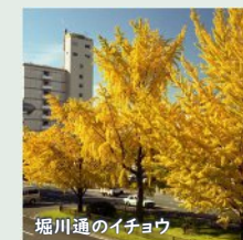
堀川通のイチョウ