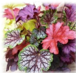
ヒューケラ （ユキノシタ科） 常緑で葉色の種類が豊富なため、1年中鑑賞することができます。