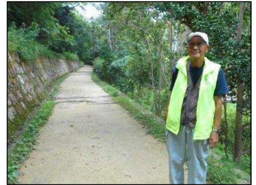
木立と石積みが続く周遊路

「みどりの会伏見桃山」は、2000年に発足。伏見城の外堀の遺構を利用して整備した伏見北堀公園（地区公園：面積6.6ha）で、26名の会員が、伏見区内外から集まって活動されています。活動は月に2回行っのほか、自主的な活動を行っているそうです。活動日ごとにテーマを決め、公園の周遊路の清掃、斜面等の草刈り、大池の葦刈り、樹木の剪定などを行っています。