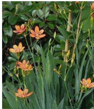
夏の間、咲き続けたヒオウギの花

また、秋頃にできるヒオウギの種は黒光りしており、古代、「ぬばたま」といわれ、和歌では夜や黒をさす枕詞「ぬばたまの」として使われました。