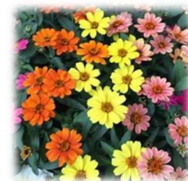
ジニア （キク科） カラフルな花色で草丈も低く育つため、夏から秋にかけて長い間、花を観賞できます。