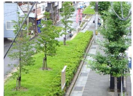
ハナミズキに更新された植栽帯