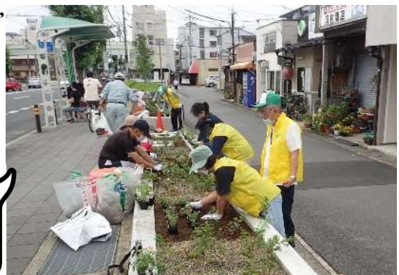
当日の作業の様子