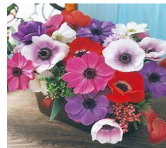
アネモネ・ポルト(キンポウゲ科)