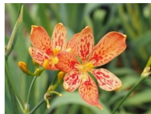
京都にゆかりのある植物