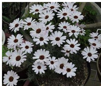
ローダンセマム(キク科)