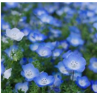
ネモフィラ(キンポウゲ科)