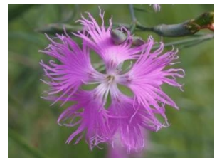
ヒオウギ（写真左） カワラナデシコ（写真右）