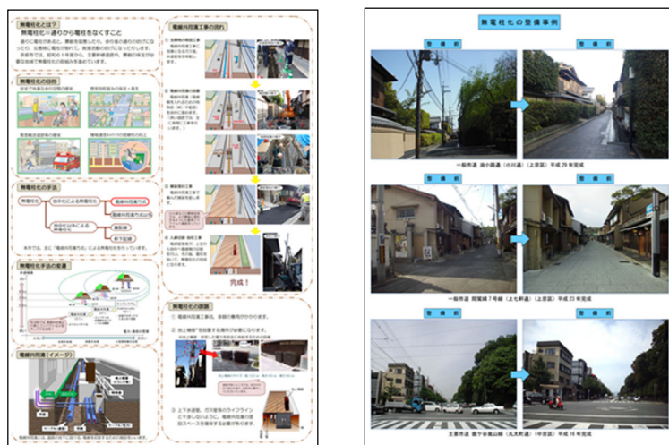
展示するパネルの一例