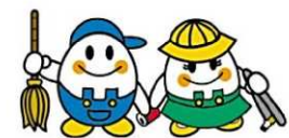
ピッカ ピッケ 京都市まちの美化推進事業団シンボルキャラクター