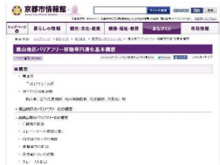
（新聞やホームページへの掲載）