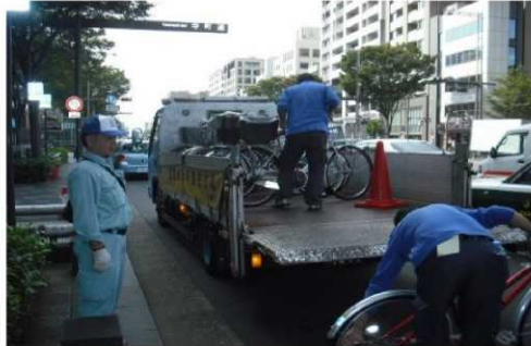
放置自転車等の撤去の様子