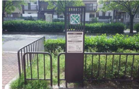
自転車撤去警告看板