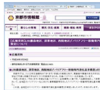
(新聞やホームページへの掲載)