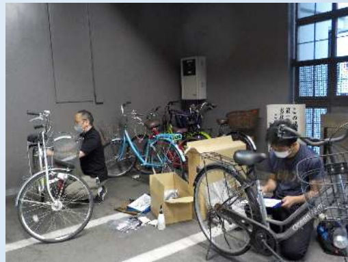
【自転車無料点検の様子】 1～2時間程度