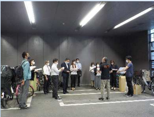
【ルール・マナー講習の様子】 10～15分程度