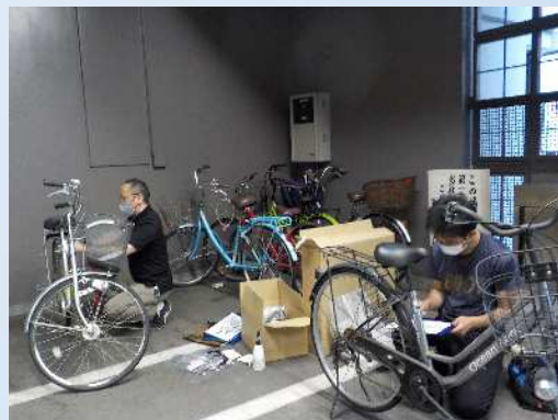
【自転車無料点検の様子】 1～2時間程度