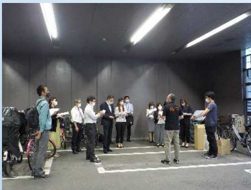
【ルール・マナー講習の様子】 10～15分程度