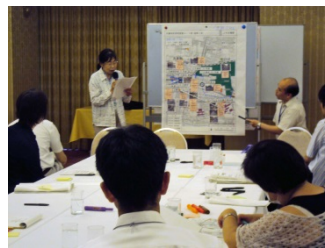
問題点発表の様子