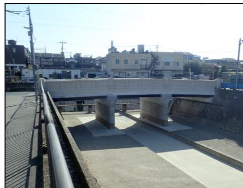
東住吉橋 伏見住吉小学校の北東にある琵琶湖疏水に架かる橋りょう