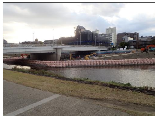
丸太町橋 丸太町通にある鴨川に架かる橋りょう