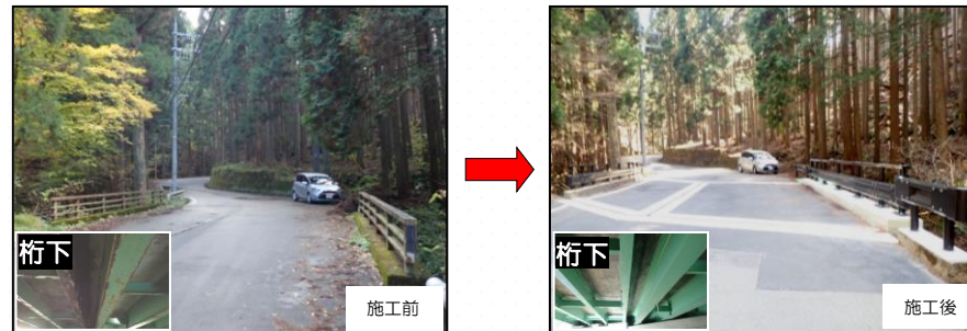
紅葉橋 左京区花背にある別所川に架かる橋りょう