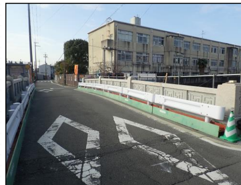
東住吉橋 伏見住吉小学校の北東にある琵琶湖疏水に架かる橋りょう