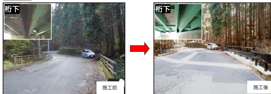
紅葉橋 左京区花脊にある別所川に架かる橋りょう