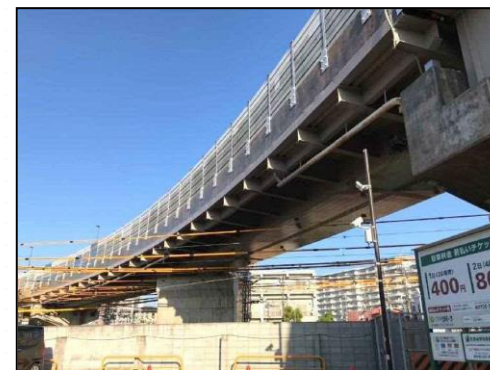
淀高架橋 宇治淀線にある京阪本線に架かる橋りょう