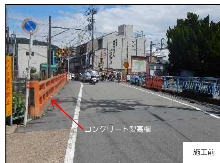
コンクリート製高欄