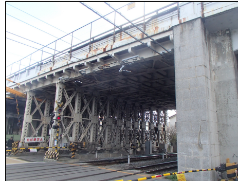
「耐震補強」 九条跨線橋 九条通にあるJR奈良線・京阪本線・鴨川を跨ぐ橋りょう