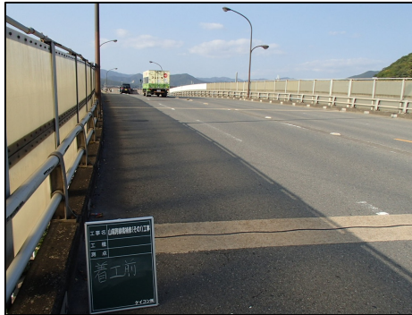
「耐震補強」 山端跨線橋 白川通にある叡山電鉄，国道367号を跨ぐ橋りょう