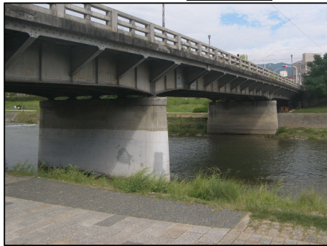
「老朽化修繕」 二条大橋 二条通にある鴨川に架かる橋りょう