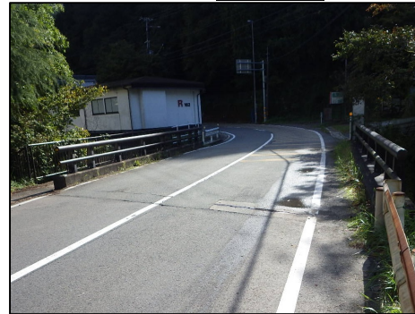
「老朽化修繕」 宮ノ辻橋 右京区京北細野町にある細野川を跨ぐ橋りょう