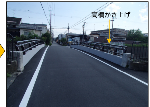
高欄のかさ上げを行い，舗装を新しくしました。

京都市では，橋の歴史や補修取組，有名な橋を紹介した冊子「 みやこ 京の橋るべ」と，道路や公園などの損傷個所を投稿するアプリ「 みやこ みっけ隊」を配信しています。