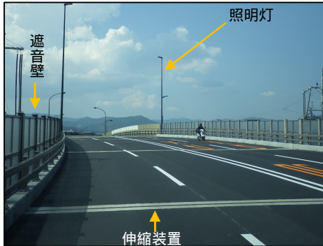
伸縮装置，遮音壁，照明灯を取替え，舗装を新しくしました。