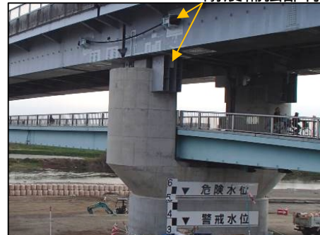
耐震補強用の部材を取り付けました。