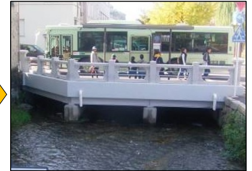
車道部を架け替え、柵をかさ上げしました。