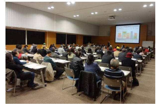
■関係権利者説明会の様子 (12月2日(金)：右京区役所大会議室)