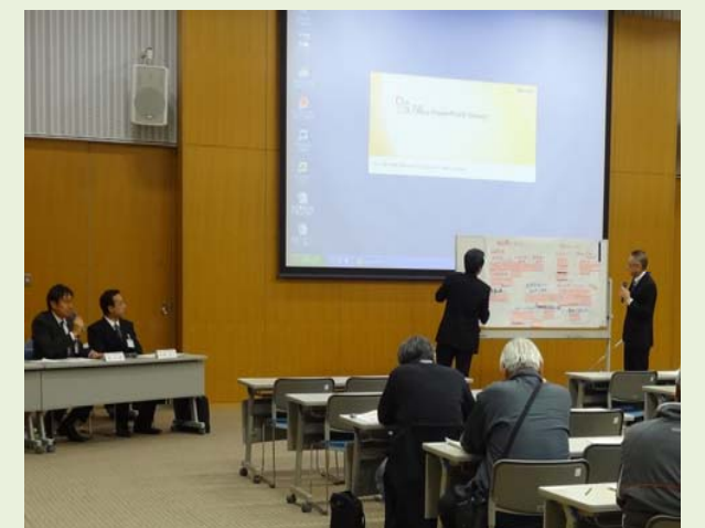
■関係権利者説明会での御意見紹介の様子 (12月1日(木)：右京区役所大会議室)

皆様からは、特に 整備手法や補償、整備スケジュール 等に関する様々な御質問を多数いただきました。