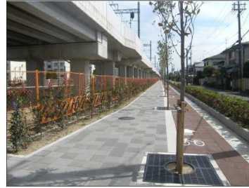
都市計画道路阪急西側道