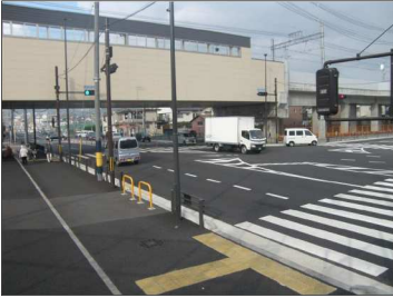
都市計画道路久世北茶屋線