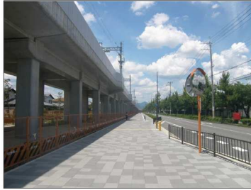
都市計画道路桂寺戸線