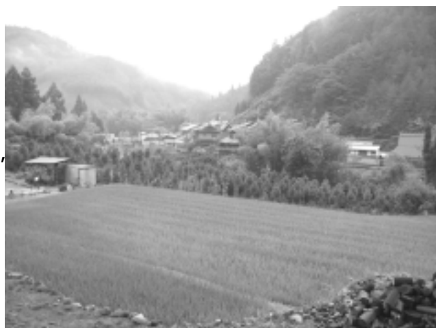
非常にきれいな空気です

トンネルのように筒状の構造物を山の中に建設すると、今までなかった風の道ができます。また、長いトンネルではトンネル内に「ジェットファン」と呼ばれる大きな扇風機のようなものを取り付け、強制的にトンネル内の空気を外に排出する(栗尾バイパスの新トンネルでも設置予定です)ので、トンネル出入口付近ではトンネル建設により大気(質)が変わってしまう可能性があります。栗尾トンネルの計画でも、いかにして影響を小さくするかなどについて考える必要があります。