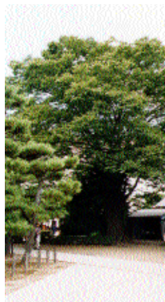
浄福寺通一条上ル 高さ 21.5m 枝張 22.0m 幹周 3.90m にれ科 / 落葉高木