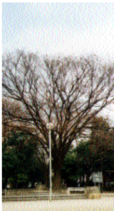
智恵光院笹屋町下ル 高さ 14.5m 枝張 20.0m 幹周 2.32m にれ科 / 落葉高木