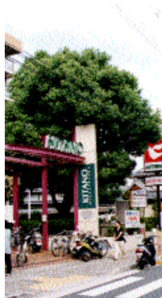
中立売通智恵光院東入 高さ 8.0m 枝張 8.0m 幹周 1.85m くすのき科 / 常緑高木