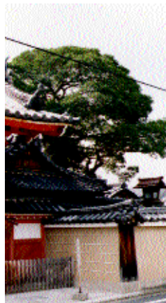
浄福寺通一条上ル 高さ 9.0m 枝張 12.1m 幹周 3.95m もちのき科 / 常緑高木