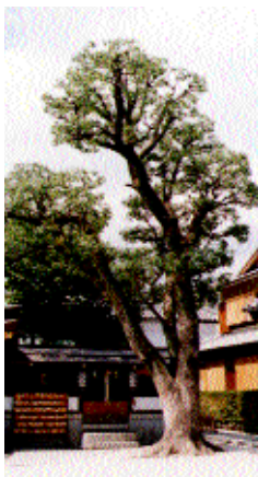
笹屋町通一条下ル 高さ 8.5m 枝張 8.6m 幹周 2.92m くすのき科 / 常緑高木