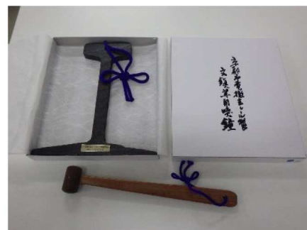
市電レール文鎮 (外箱サイズ：18.5cm×16cm)