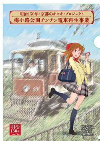
オリジナルクリアファイル (デザインイメージ)