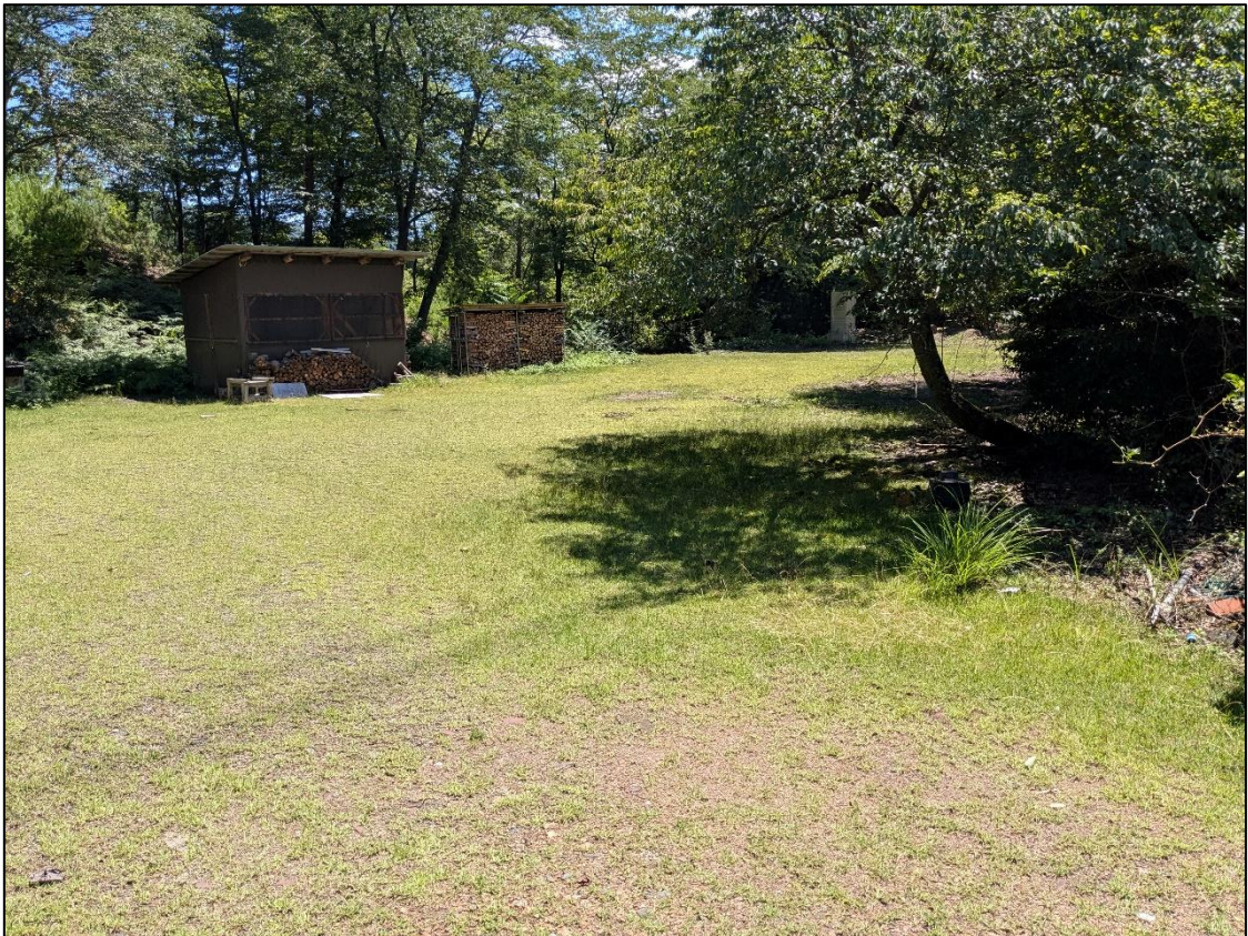
京都府立大学大枝演習林