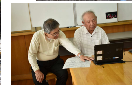
↑ 新町小学校での出前授業の様子 「堀川の歴史とホタルの生育」について