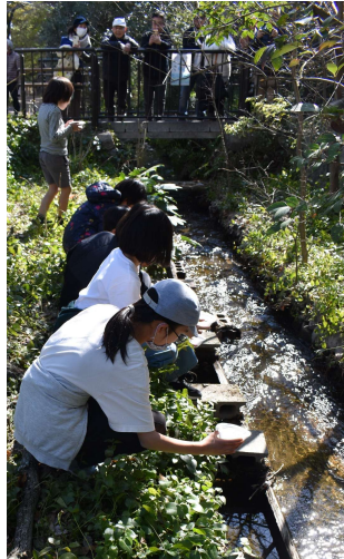
↑ 堀川ほとるの森に ホタルの幼虫を放流

中立エコ生活推進会議のメンバーと地域住民が、地元の小学4年生を対象に、堀川地域での役割について、出前授業を実施。自然を取り戻し、ホタルを毎年見られる環境づくりを目標に、子どもたちが堀川でのホタルの育成や清掃活動など、自然環境保護の取組を実施。