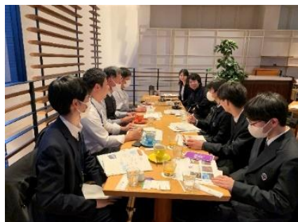
↑ 農福連携事業の打合せの様子