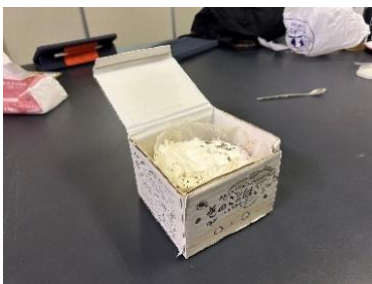
↑ きのこの菌糸を植え付け、菌糸を蔓延させた状態を作ること成功