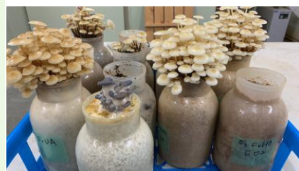
↑ きのこを栽培している様子